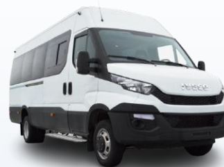
Междугородный микроавтобус IVECO Daily