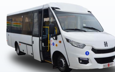
Туристический автобус Неман