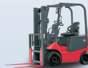
Вилочные электропогрузчики NICHYU