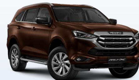
Внедорожник ISUZU Mu-X