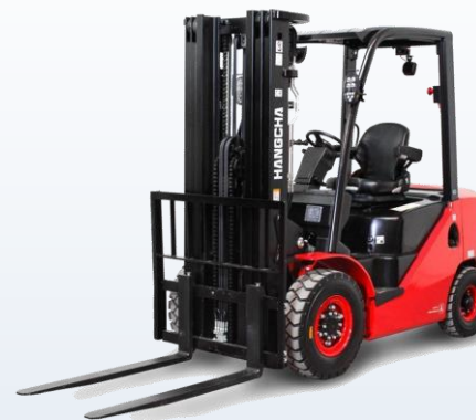
Вилочные погрузчики Hangcha