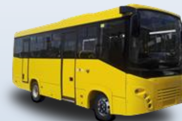
Междугородный SIMAZ 2258-526