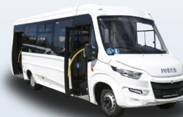
Городской автобус Нижегородец VSN 700