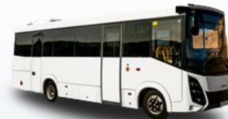
Междугородный SIMAZ 2258-526