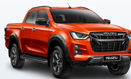
Пикап ISUZU D-Max