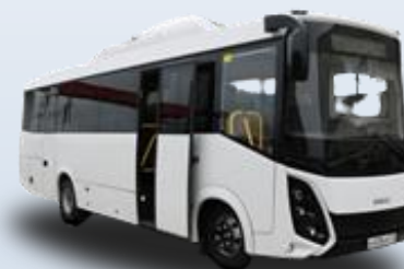
Междугородный SIMAZ 2258-30