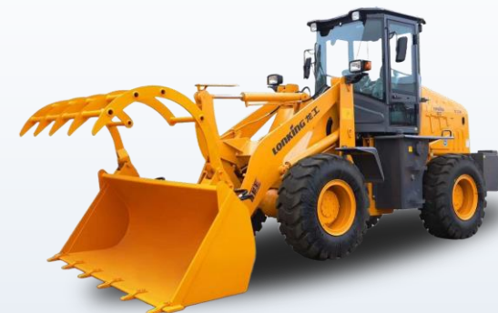
Фронтальные погрузчики Lonking