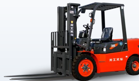
Вилочные погрузчики Lonking