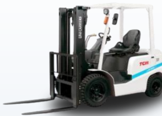
Вилочные электропогрузчики TCM