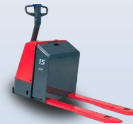
Перевозчики поддонов NICHYU