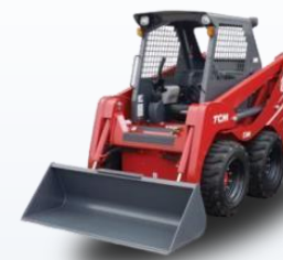
Универсальные мини погрузчики TCM