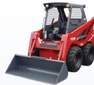
Универсальные мини погрузчики