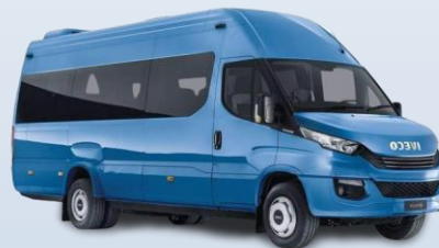
Микроавтобус IVECO Daily