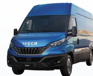
Серия легких грузовиков IVECO Daily