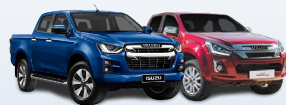
Пикапы ISUZU D-Max