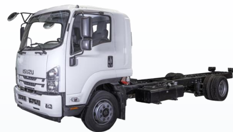
Среднетоннажная серия ISUZU FORWARD