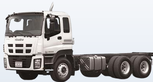
Тяжелая серия ISUZU GIGA