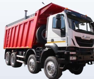
Серия крупнотоннажных грузовиков IVECO Trakker