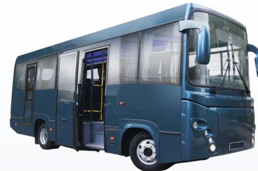
Междугородный SIMAZ 2258-526