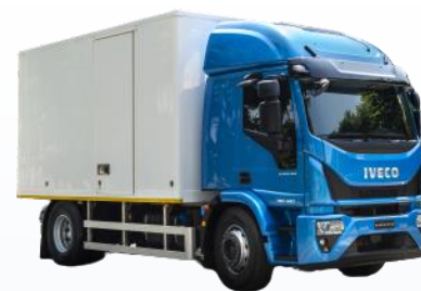
Серия универсальных грузовиков IVECO Eurocargo