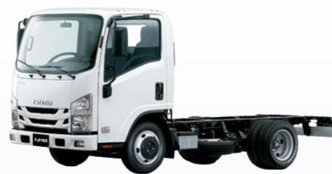
Малотоннажная серия ISUZU ELF