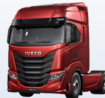
Магистральный тягач IVECO Stralis