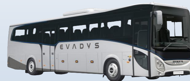
Автобус IVECO повышенной вместимости